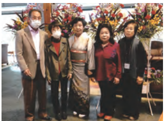
3月27日(日) 豊川市文化会館 中ホール

○みちびき歌の同好会 みちびき歌の同好会 春まつり この時期、まだまだコロナが猛威をふるっていきまして、開催する事に悩みましたが、皆様の「参加するよ」の声に押されて行いました。大勢の方にご参加頂き、何事もなく無事終了いたしました。