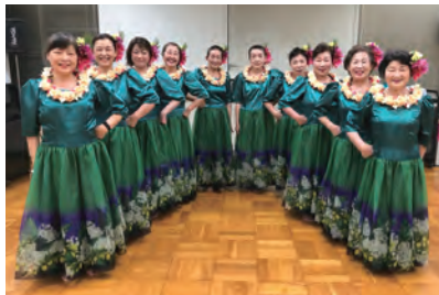
6月12日(日) 豊橋市民文化会館

コロナ禍の為、二年間フラの発表会がありませんでしたが、今年開催する事が出来ました。久しぶりに練習の成果を発揮出来る舞台に立ち、みんな緊張感の中、フラダンスが出来ると喜びを感じ、笑顔で、無事終わりました。とても楽しく、有意義な一日を送る事が出来ました。