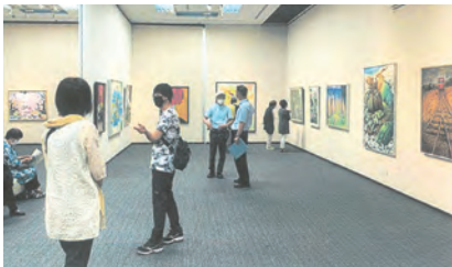
6月28日(火)~7月3日(日) 桜ヶ丘ミュージアム 第1~3展示室

○みちびき歌の同好会 みちびき歌の同好会 春まつり この時期、まだまだコロナが猛威をふるっていきまして、開催する事に悩みましたが、皆様の「参加するよ」の声に押されて行いました。大勢の方にご参加頂き、何事もなく無事終了いたしました。