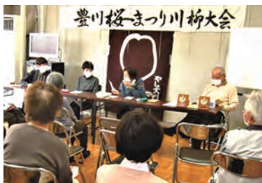
4月9日(日) 代田市民館(新道町)