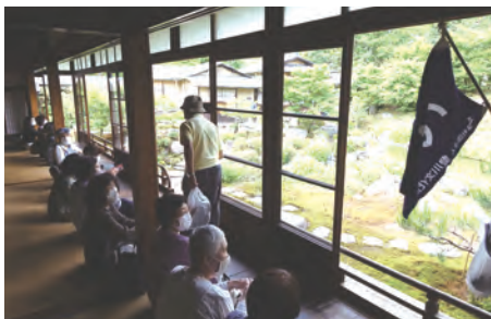
建仁寺塔頭兩足院

予定時間より三〇分遅れましたが、皆様のご協力と運転手さんの安全運転で無事、桜ヶ丘ミュージアムに到着できました。ありがとうございました。ありがとうございました。