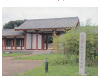
三河国分尼寺(豊川市八幡町)

三河国分寺と国分尼寺は八世紀後半には完成したようであり、近年の発掘調査の結果、金堂・講堂・塔などの壮大な伽藍跡が確認されている。そして国分尼寺の中門と回廊が建物復元され、史跡公園として整備された。隣接する「三河天平の里資料館」も展示が充実している。古代三河の天平遺産が現代に蘇ったようすを、ぜひ一度見学してみてもいい。