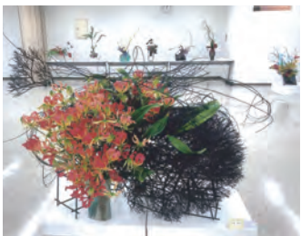
3月20日(日)、21日(月・祝) やねのにつぼうホール(プリオ5階)

今後楽しく、美しいいけばな展が開けますよう、精進してまいります。 よろしくお願 いいたします。