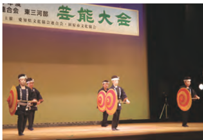
日本民謡研究会 ひばり会