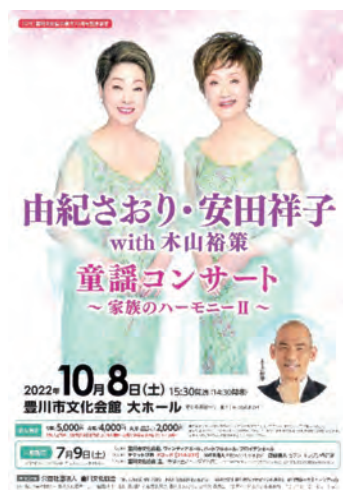
● 由紀さおり・安田祥子 with 木山裕策 童謡コンサート