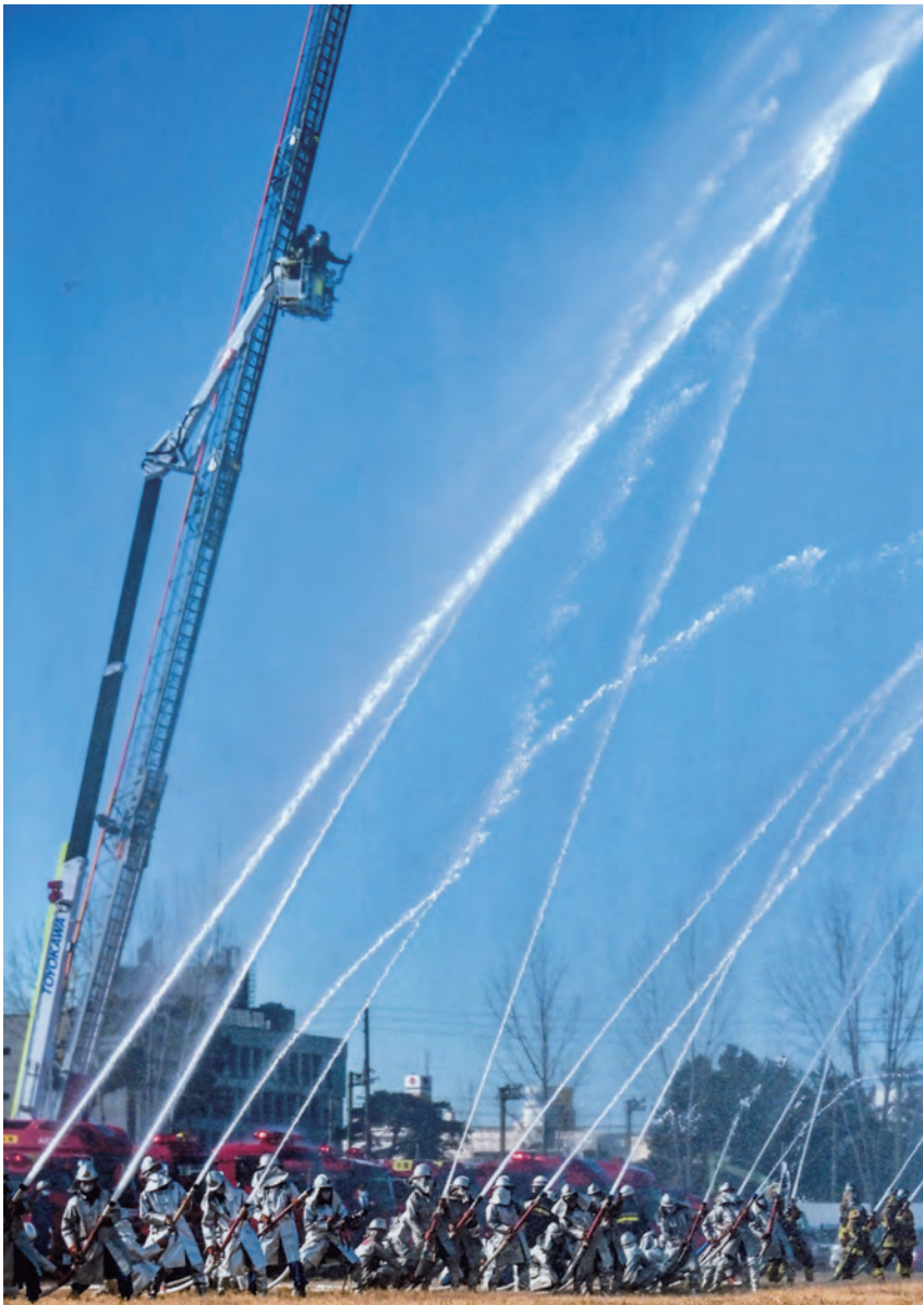
豊川市消防出初式