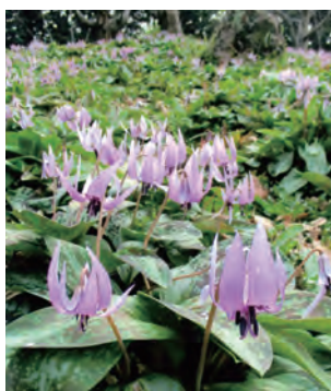
早春に咲くカタクリ

春の花といえば梅や桜であろ う。だが歌数は一首でも、万葉の 春を代表する花がある。越中国守 大伴家持の詠んだ歌がそれだ。 もののふの八十娘子らが汲み まがふ寺井の上の堅香子の花