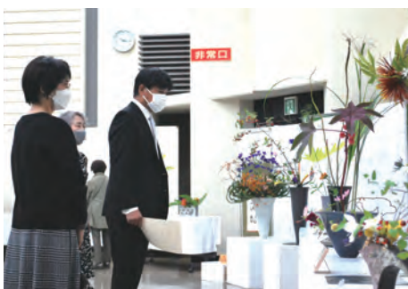
10月22日(土)・23日(日) 会場…豊川市勤労福祉会館

その会場に様々、流派ごと特 徴のある古典花やテーマを持つ た現代花が並び、秋色いっぱい、 生き生きと輝いて見えました。 今、無事華展を終えて、皆様 方に感謝をして居ます。