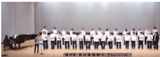
10月29日(土) 会場…豊川市文化会館 大ホール

三年ぶりに開催しました。 コロナ感染が治まりきらず、小学校・幼稚園・保育園の参加はありませんでしたが、七団体の出演・発表がありました。 オカリナ演奏と男性カルテットの初めての出演をいただき、よい交流と親睦の機会となりました。