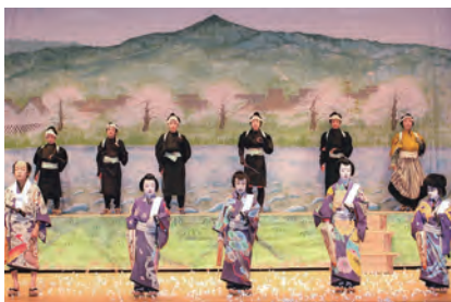
10月23日(日) 会場:ウィンディアホール

待ちかねし舞台幕開け 三年ぶりに「赤坂の舞台伝統芸能公演」がウィンディアホールで開かれました。二宮南部小学校歌舞伎クラブ部員は、実演の機会がないまま中学進学。そこで、過去二年間の部員を誘い『白浪五人男』一幕を演じました。また、『赤坂並木』は御当地所縁の演目。 宜敷御指導御願申上候。