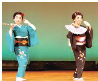
9月末～11月上旬 会場：引佐・小坂井・三ヶ日・豊川

Withコロナが文化祭にも浸透し、久しぶりに所々の舞台に華が咲きました。引佐・小坂井・三ヶ日・豊川と九月末より文化祭づくしでした。会員は出演に向けてお稽古にも力が入り、芸の上達に良い刺激となった実りの秋となりました。