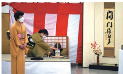
11月13日(日) 会場…西尾市文化会館

茶道部 の方々の 協力を頂 き、検温・手指の消毒・マスク 着用・追跡確認など以前とは異 なったおもてなしとなりました。