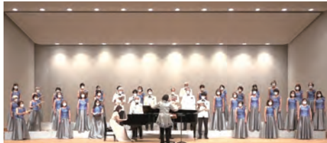
7月17日(日) 会場…豊川市文化会館 大ホール