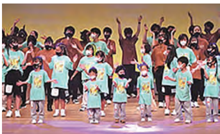
令和4年12月18日(日) 豊川市文化会館 大ホール

昨年末まだコロナ禍ではありましたが、無事に発表会を終えました。第十五回となる今回のテーマは「夢」。メンバーみんなの身近な目標や大きな夢をダンスで表現しました。本番に向かって頑張って練習した成果を全員が発揮し、パワー全開で踊り終える事ができ楽しかったです。