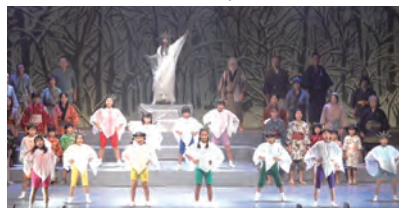
令和4年12月17日(土)・18日(日) ハートフルホール

子どもたちがやりたいと団内プレゼントした作品。コロナ禍でもパート音源を作ったり、練習風景を録画し団員に配信するなど歩みを止めず、当日は抗原検査をして全員マスク無しの舞台。二日間の公演は満席で、「生の舞台はいいですね。」と観客にも喜んでいただきました。