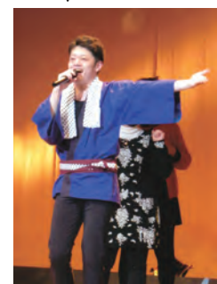
令和5年1月8日(日) 豊川市文化会館 中ホール

オープニングも華やかに歌唱を中心に、舞踊、剣詩舞、フラダンス等、素晴らしい歌声と演舞に多くの拍手を頂きました。ファイナリはスタッフの皆さんも舞台上がり、大トリの歌う『春夏秋冬・夢祭り』で大いに盛り上がりました。