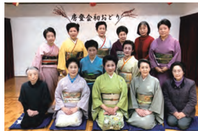
令和5年2月4日(土) 牛久保生涯学習センター

ご来場の皆様とも楽しい時間を過ごすことが出来、穏やかな日常が少しずつ戻って来たことに感謝して、これからは輪をつないでいきたいと思えます。