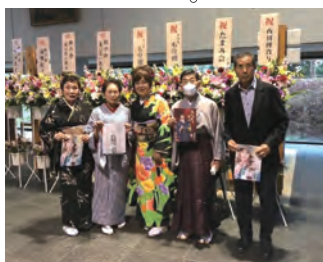
令和4年11月23日(水・祝) 豊川市文化会館 中ホール

当日は百三十八組の皆様により「きらめきオンステージ」「おはこ花舞台コーナー」等それぞれのステージ・コーナーで熱唱・熱演をいただきました。