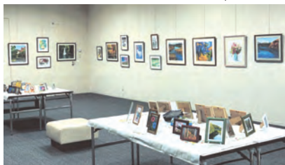
令和4年12月6日(火)～11日(日) 桜ヶ丘ミュージアム 第4展示室

会員の高齢化もあり規模を縮小しての開催でしたが、鑑賞者や出品者が楽しめるよう壁面以外にも机上の小作品の展示等工夫をしました。