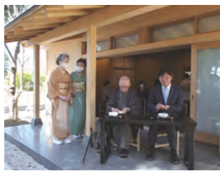
令和5年3月19日(日) 立礼席

令和四年六月より着工していた心々庵の改修と立礼席の増築工事が完成し、オープンに合わせて春の市民茶会が開催されました。