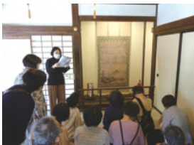
瓢鮎図の解説を聞く参加者

最後に妙心寺の退蔵院を見学しました。方丈をとり囲む枯山水庭園「元信の庭」と、池泉回遊式庭園「余香苑」が楽しめます。方丈前には、有名な「瓢鮎図(模本)」があり、禅問答が書かれています。説明で、書院の中には、茶道が禁じられた時代に造られた小さな隠れ茶室があり、皆さん興味深く眺めていました。