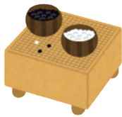
6月11日(日) 小坂井生涯学習センター