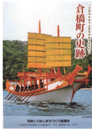
復元された遣唐使船

おり、許勢祖父の人選も早くに決められていたようだ。彼は渡海の任を受けるまで三河守として持統の行幸準備に歳月を費やしたのである。