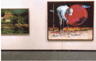
5月2日(火)~7日(日) 桜ヶ丘ミュージアム 第1・2展示室

例年よりも出展数が少ない分、個性あふれる見応えのある作品が多く展示出来た事をうれしく思います。