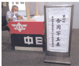
7月11日(火)~16日(日) 桜ヶ丘ミュージアム 第1展示室

るために始めました。残念ながら本部が今年度で解散となるため、最後の合同写真展となりました。