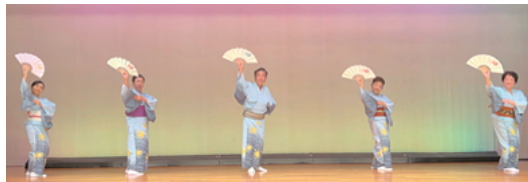
7月9日(日) 一宮生涯学習センター