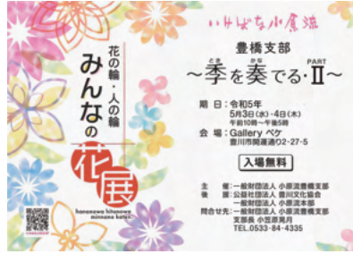
5月3日(水・祝)、4日(木・祝) ギャラリー・ペケ開運通