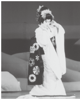
平成24年5月20日(日) 会場…文化会館大ホール

「お陰さまで二十五周年」のサタイトルで、今年も大ホールに満席のお客様を迎え、地域の福祉活動も定着、華麗な舞台に、満足というお土産をお持ち帰ります。