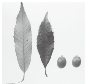
イチイガシ 葉 実