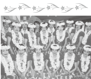
平成24年5月20日(日) 会場…新城市文化会館

一年間の練習成果をエンジョイフラで発表します。華やかで素敵なフラを踊ったり、他のクラスのを観たりして一日を有意義に過ごします。