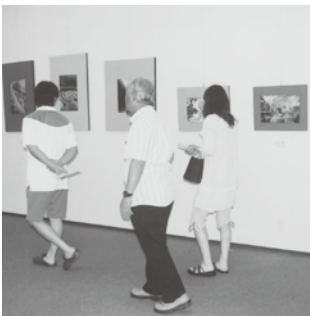
平成24年5月29日(火)～6月3日(日) 会場…桜ヶ丘ミュージアム

豊川文化協会、豊川フォトクラブの展示を(第三十四回)また、六月一日の写真の日を挟んで開催いたします。クラブの傑作を見に来て下さる事、お待ちしております。