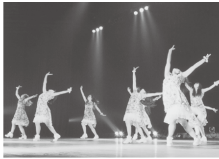
平成24年7月15日(日) 会場…文化会館大ホール

今回は「ダンスの力」をテーマにチャリティー公演をして募金を集め、震災義援金を寄付する事ができ、みんなの結束や充実感で思い出深い発表会となりました。