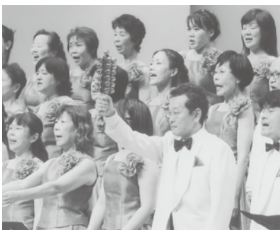
平成24年7月8日(日) 会場…文化会館大ホール

「開運招福、豊川長草御殿萬歳」の台本を元に千原英喜氏に作曲を委嘱していただき、当日は、地元保存会の方々が演じられた後、鳴り物入りで合唱いたしました。