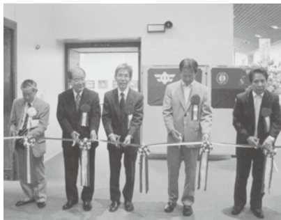
平成24年5月22日(火)～27日(日) 会場…桜ヶ丘ミュージアム

創立五十周年記念写真展に於いては、オープニングセレモニーを行い、多数の方々に、ご高覧を頂きありがとうございます。今後共よろしくお願ひ申し上げます。