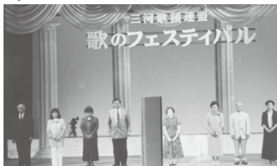
平成24年5月6日(日) 会場…文化会館中ホール

平成二十四年五月六日豊川文化会館中ホールにて歌謡局歌謡の部三河歌謡連盟のフェスティバルが開催され、文化協会内の舞踊局五団体が参加され、注目されました。歌謡局・舞踊局の今後の発展を誓いました。