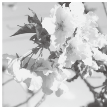
里ザクラ(オオシマザクラ系) アリアケ(有明)

注：収縮期血圧が一四〇以上または拡張期血圧が九〇以上に保たれた状態が高血圧であるとされています。近年の研究で血圧は高ければ高いだけ合併症のリスクが高まることがわかっており早期からの管理が必要です。