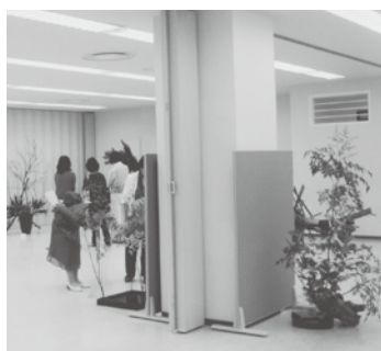
平成24年6月23日(土)・24日(日) 会場…プリオホール

二十四回目になりました紅の会の社中展が、会員力をあわせて行う事ができ、多くの皆様にご来場いただきました。ありがとうございました。