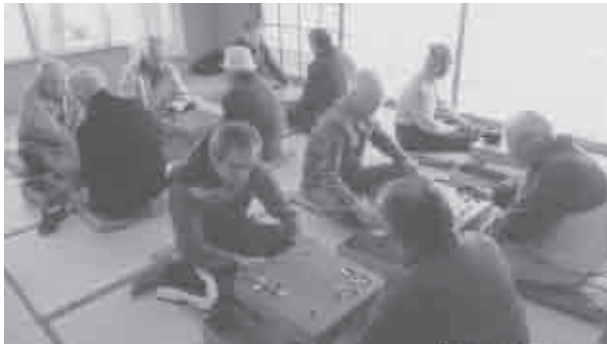
平成25年11月17日(日) 会場…小坂井生涯学習会館

事業には、春秋二回の大会があります。定例会と違って全てが新鮮に感じるのが不思議です。普段通り打てるのができれば良いのですが、皆の顔が輝いているのが又いいものです。さて、優勝者は？