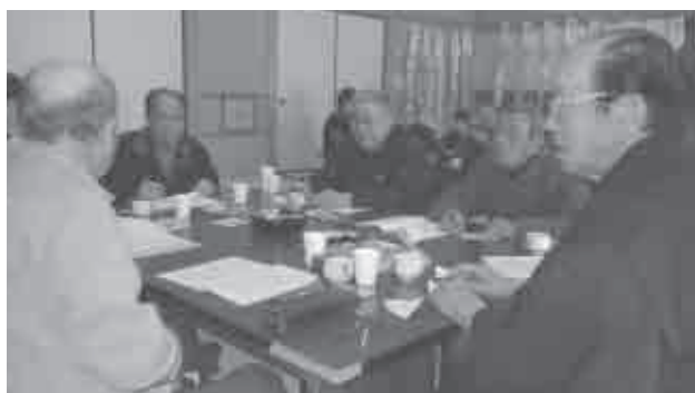
平成25年度桜まつり狂俳大会 (桜ヶ丘ミュージアム和室)