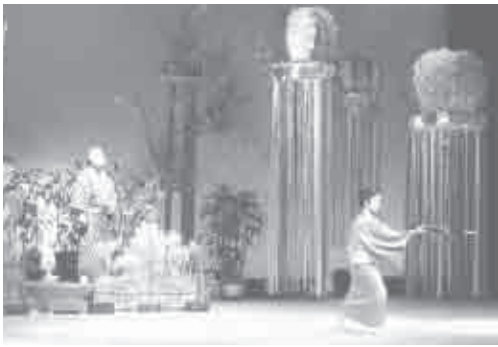
平成25年10月20日(日) 会場…ハートフルホール

これも日頃の練習の賜物で、努力に勝るものは無いと云うことです。舞台作りも会員総出で行い、すばらしい舞台になりました。少年、少女の剣詩舞がだんだん力をつけていく一方で高齢者の方の健康障害で出場できなくなる事が淋しい限りです。会員には、体を労わりつつ吟道に精進する事を願います。