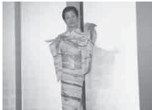
鯉貴与の会の演舞

乾杯の後、文化協会日本舞踊局の西川流鯉貴与の会・貴昇左の会による舞踊の演舞披露を鑑賞し、出席者一同が楽しく交流いたしました。