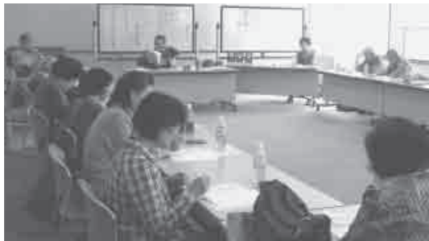
平成26年度桜まつり短歌大会 (ウイズ豊川)