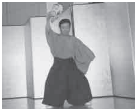
貴昇左の会の演舞

乾杯の後、文化協会日本舞踊局の西川流鯉貴与の会・貴昇左の会による舞踊の演舞披露を鑑賞し、出席者一同が楽しく交流いたしました。