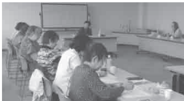
平成26年度桜まつり俳句大会 (ウイズ豊川)