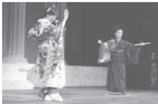
平成26年2月9日(日) 会場…文化会館中ホール

発表会を盛大に、にぎやかに開催させて頂きました事は、細部まで皆様のご指導、ご協力のお陰と心より感謝します。厚くお礼申しあげます。