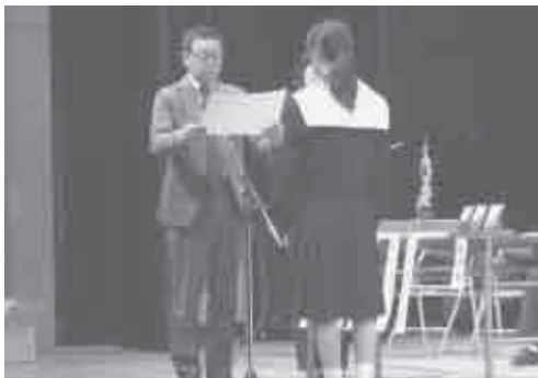
平成26年1月26日(日) 会場…文化会館中ホール

今年度は、ピアノ独奏部門、管・弦楽器独奏部門に一五名、管・打楽器部門に十団体の参加を頂き、無事終える事ができました。豊川市長賞には豊川市立南部中学校が選ばれました。