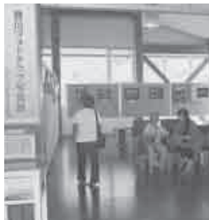
平成26年7月17日(木)~31日(木) 会場…本宮の湯ギャラリー

創設して三十七年、東三河では、一番古い文化活動で誇れるクラブです。誰でも年間二千元のクラブ費で入れます。写真を楽しみたい人なら誰でも大歓迎です。