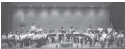
平成26年6月29日(日) 会場…文化会館中ホール

気ソング特集、ミュージカル特集の三つのステージで構成し、お客様と楽しく演奏会を作り上げることが出来ました。