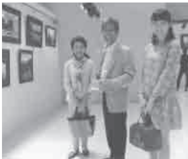
平成26年5月12日(月)~18日(日) 会場…勤労福祉会館ロビー

全紙写真三十三点三十三人による写真展が行われ、期間中六百十人にご高覧頂きありがとうございました。