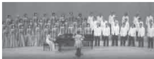
平成26年7月27日(日) 会場…文化会館大ホール

わが団の一年間で最大の事業は、毎年七月に行う定期演奏会です。今年は八八四人の方に御入場いただき、好評、盛会のうちに終えることが出来ました。