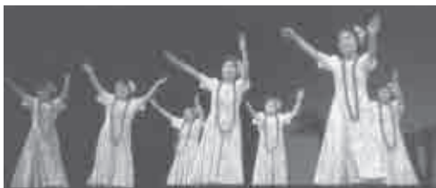
平成26年7月20日(日) 会場…新城文化会館大ホール

楽しさと緊張の瞬間を味わいました。各クラブのフラを観るのも楽しみです。フラの華やかさとやる気になった日でした。