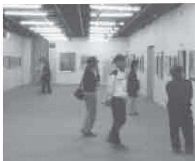
平成26年4月23日(水)~27日(日) 会場…文化会館展示室

今回が十四回展となります。毎回多くの方々にご高覧いただき、ありがとうございました。