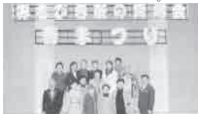
平成26年4月20日(日) 会場…文化会館中ホール

4月に「春まつり」を開催しております。最近テレビや新聞でカラオケは、健康によいとのこと。私達は高木会主のもと和気あいあいと稽古をしております。