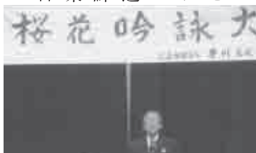
平成26年4月6日(日) 会場…労働福祉会館大研修室

開演九時三十分約百三十人の合吟で始まり、俳句、漢詩、和歌、新体詩、歌謡吟と多彩なジャンルの違いも新鮮に感じました。