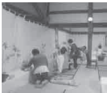
平成26年5月5日(月・祝) 会場…豊川稲荷本堂

豊川稲荷の大祭で豊川生花講によるミニ花展を開催しています。本殿にて華道の発展祈願をします。大勢の皆さんに花を楽しんで頂き呈茶の接待もしています。