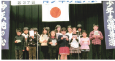
平成27年2月11日(水・祝) 会場…勤労福祉会館

「未来へ、はばたけ、わかあゆ」と題し、青少年吟道大会を開催しました。県内外から大勢の青少年が参加し盛大に行われ、多くの識者から高く評価されました。