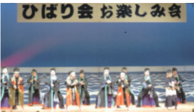
平成27年3月1日(日) 会場…ハートフルホール

開会にあたり八十五才の方二名を表彰し、又、阿波の鳴門の寸劇をしたりして、大勢のお客様と楽しみました。精進を重ね地域の生涯活動として努力したいと思えます。