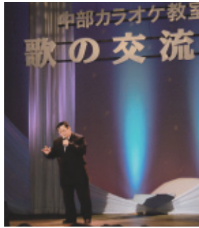
平成27年3月1日(日) 会場…文化会館中ホール

あいにくの天気でしたが舞台会場は歌と踊りの大パノラマ。文協舞踊部の方々の御協力により満員の客席で終演いたしました事を心より御礼申し上げます。来年で四十周年となります。中部記念交流会に向け精進努力して参ります。