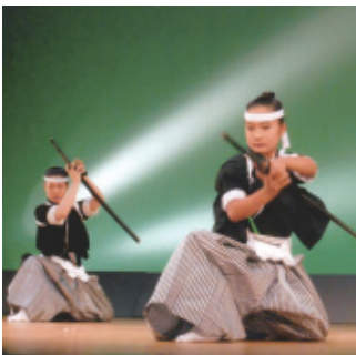
平成27年3月22日(日) 会場…文化会館中ホール

剣詩舞を好み愛する同胞達が、一市四町が合併する事になり、私達の交流もより一層盛んになり、技術の向上、情報交換も多く私達の舞台も賑やかになりました。