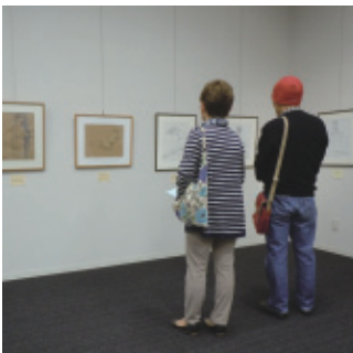
平成27年3月31日(火)～4月5日(日) 会場…桜ヶ丘ミュージアム

当会は自己研鑽の場として、月二回桜ヶ丘ミュージアムにて短時間で裸婦の素描を行なっている東三河でも特異な同好会です。皆様のご入会を歓迎します。