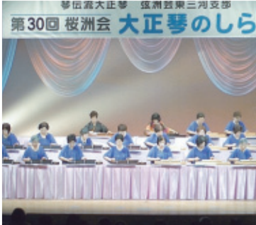
平成27年3月8日(日) 会場…新城市文化会館小ホール

昭和61年に第1回の発表会を行い30年、澄んだ音色と合奏曲の楽しさ、仲間との絆、応援して下さる皆様への感謝、小さな楽器大正琴で大きな贈物を沢山ありがとうございました。