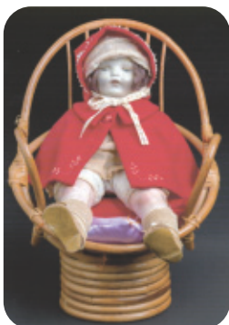
還暦を迎えた田峯小のグレイス

豊川市の千両小と幸田町の豊岡小に贈られた人形は、戦後まで生き残ったことは確認されているが、その後行方不明となっており、いまだに消息がわからない。今後に期待したい。