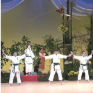
平成26年11月16日(日) 会場…ハートフルホール

歌謡吟詠は、歌謡曲の一部に詩吟を取り入れたものです。会員の歌謡吟詠、詩舞、舞も素晴らしく又青少年の空手演武もあり、若さの活力をもらいました。