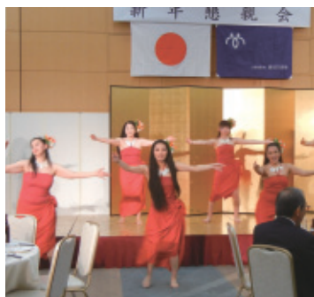
タヒチアンのフラ(ダンス)

乾杯の後、洋舞踊局の「リア」「タヒチアン」「アワプヒ」の三団体による華やかなフラ(ダンス)の披露がありました。そして懇親の時間では、普段会うことの少ない方々と有意義な交流を図ることが出来ました。