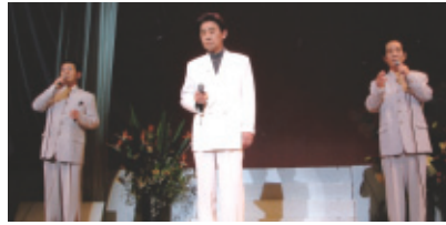
平成27年1月18日(日) 会場…文化会館中ホール

新年を迎え又今年も歌謡祭が出来ました。歌と舞踊の会の皆様の温かいご協力に心より感謝申し上げます。今後も、会員一同一丸となってがんばります。