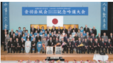
平成29年2月26日(日) 会場…豊川市音羽文化ホール