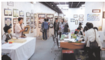
平成28年9月15日(木)～18日(日) 会場…豊川市文化会館 展示室