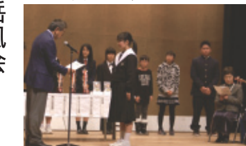
平成29年1月15日(日) 会場…豊川市文化会館 中ホール

第十一回ほろ子ども音楽祭 前夜からの大雪の影響で開催が危ぶまれましたが、エントリーした八十一名全員が参加し無事終了しました。ピアノ・管・弦・打楽器といういろいろなジャンルの音楽が発表・審査されました。来年は一月十四日に開催します。