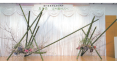
平成29年2月26日(日) 会場…市民プラザ