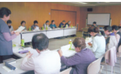
平成28年11月17日(木) 会場…ウイズ豊川

老連俳句大会も年を重ね早二十年、文化協会からの盾と賞状を励みに一同頑張っています。月一回のウイズでの例会も和気藹々の良い句が出来た時の喜びを噛み締め年二回の俳句大会へと繋げて居ります。