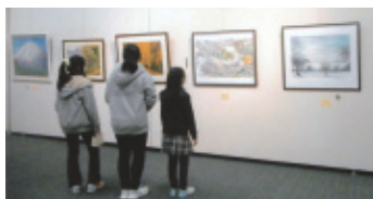
平成29年2月7日(火)～12日(日) 会場…桜ヶ丘ミュージアム 第1～4展示室

寒い中、九百名を超える多くのご来場をいただき会員一同心より感謝しています。今後も切磋琢磨し制作に励みたいと思えます。