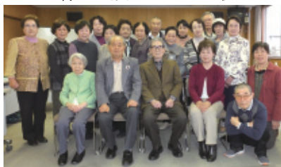
平成28年11月17日(木) 会場…ウイズ豊川