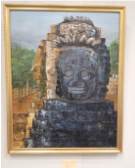
平成29年11月28日(火)～12月3日(日) 会場…桜ヶ丘ミュージアム 第2・3展示室

豊川で三グループが集合して活動している豊川油彩会の会員二十名が、油絵中心で個々の個性を十二分に生かしたこだわりの作品四十四点を展示しました。会員一同今後も切磋琢磨し互いに励まし合っていきます。