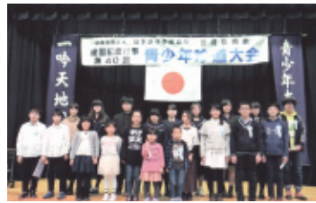
平成30年2月11日(日・祝) 会場…勤労福祉会館

「未来をめざして、かがやけわかあゆ」と題し青少年吟道大会を開催しました。県内外友好会から多くの青少年が参加し盛大に行われ、多くの識者から高く評価されました。