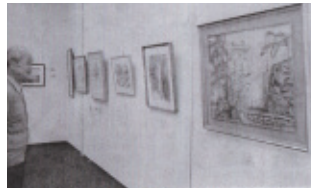
平成29年11月28日(火)～12月3日(日) 会場…桜ヶ丘ミュージアム 第1展示室