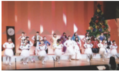
平成29年12月10日(日) 会場…ウィンディアホール