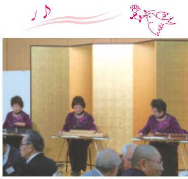
琴伝流大正琴桜洲会

恒例となっております文化協会の新年懇親会が一月十二日(金)に市民プラザで開催されました。市長をはじめ国県市議会議員など多くの来賓の方々にご出席いただき、総出席者百七十二人の会となりました。