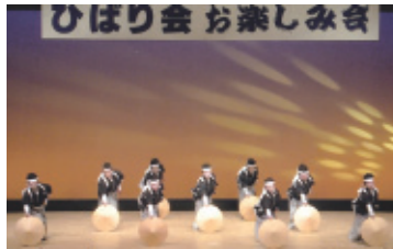
平成30年2月18日(日) 会場…ハートフルホール

今回は今迄練習した想い出深い曲目を踊りました。会員も高齢化が進み、足や腰が痛いと言いつつも、大勢の観て頂きお客様に観て頂きお楽しみ会をしました。