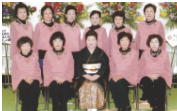
平成30年2月18日(日) 会場…新城文化会館