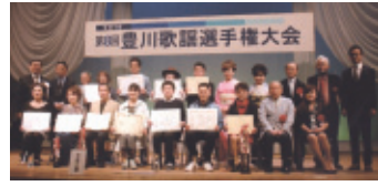
平成30年4月8日(日) 会場…豊川市文化会館 中ホール

東三河、西三河、尾張、浜松方面からの参加者も増え、総勢二百四十四名で出場者、応援者一体で大いに盛り上がりました。今後も益々充実し、満足する大会を目指します。