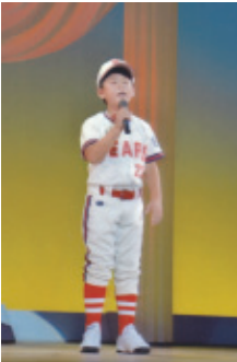
平成30年7月8日(日) 会場…豊川市文化会館 中ホール

歌・踊り・銭太鼓・太鼓など、人と人の和を結び思い出の一ページになりました。御協力御支援をいただき盛大に終える事が出来、ありがとうございます。