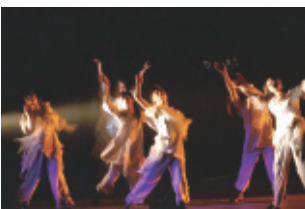
平成30年6月3日(日) 会場…豊川市文化会館 大ホール

第十二回を迎えた今回のテーマは「ヒーロー!!」。だれもが胸にあるあこがれのヒーローに変身して踊り、衣装やストーリーも夢のある華やかなステージをメンバー一丸となつて作りあげ、とても内容深い舞台となりました。