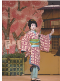
平成30年6月17日(日) 会場…フロイデンホール

私どもの会は、出演者から裏方全ての者で創り上げる舞台です。その雰囲気客席を巻き込み会場が特別な空気に包まれます。今回も、お客様・会員ともに充実した素敵な一日を過ごしました。