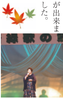
平成30年5月13日(日) 会場…一宮生涯学習会館

地元なら出演してみようかと言う人の集まりで新緑歌の競演の二十五回目を楽しく終える事が出来ました。