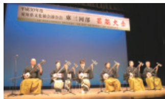
平成30年7月8日(日) 会場…新城文化会館

私どもの活動母体である加藤流三絃道・藤秋会は、北は秋田、南は福岡、そして関東、関西、名古屋と、全国で演奏活動をしており、一方、地元で津軽三味線を演奏する機会は少なく、今回はまたとない機会をいただきました。このような良い機会をいただくことで会員の励みにもなり、感謝しております。