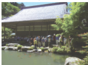
百 済 寺

草履御守りは寺務所にあると案内がありました。石段を登り、本堂。入り母屋松皮葺きで山門とともに一六五〇年(慶安三年)の建立。本尊十一面観音菩薩立