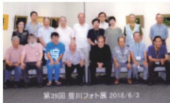
平成30年5月29日(火)~6月3日(日) 会場…豊川市桜ヶ丘ミュージアム 第1・2・3展示室

来年の四十周年を最後として終わります。時代はタブレットに変わり、今後どんな形に変化していくか分からない時代に代り入りました。