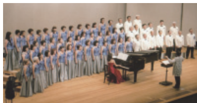
平成30年7月22日(日) 会場…豊川市文化会館 大ホール

兵庫県をテーマにした十曲と、「振り」も交えて愛唱歌五曲。その後お客様も舞台上に「みんなで歌いましょう」で盛り上がり、最後は中島みゆき傑作選として「地上の星」など五曲を歌いました。