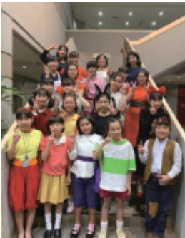
12月8日(日) 会場…ハートフルホール

定期演奏会では、アカペラとオリジナルソング、ジブリの歌のプログラムで二十曲を歌い上げました。パプリカの歌では、会場といっしょに歌って踊り、楽しく盛り上がる事ができました。