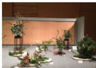
2月29日(土)～3月1日(日) 会場:穂の国とよはし芸術劇場プラットアートスペース

百十九名の出版者と二千名のご来場を頂き記念花展を華々しく開催致しました。初めての会場にて、又このような情勢の中「いけばな」の果たす役割は大きく人々に心の豊かさをもたらす物と思います。