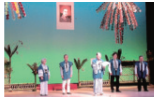
11月17日(日) 会場…ハートフルホール

舞の方々に華を添えて頂きすばらしい舞台となりました。皆、仲良く楽しい大会でした。