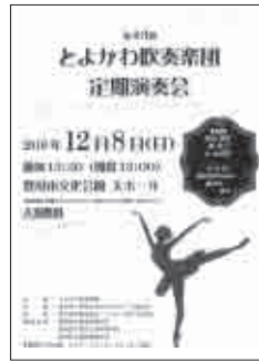
12月8日(日) 会場…豊川市文化会館 大ホール

スネア担当者一人から演奏が始まり、会場内各場所より団員がステージに集まって、最後は全員での合奏を行い、好評でした。