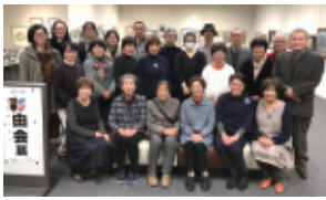
11月26日(火)～12月1日(日) 会場:桜ヶ丘ミュージアム 第4展示室

彩由会は油彩・水彩・アクリル画やデジタル画など、表現の幅を広く会員は楽しみながら模索し制作活動をしています。