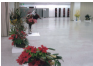
2月23日(日)・24日(月) 会場:やねのにつぼうホール