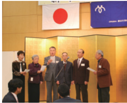
詩吟部代表の皆さん

乾杯後のアトラクションは、詩吟部代表の皆さんによる「名槍日本号」が吟じられ、大きな会場に自慢の喉が披露されました。