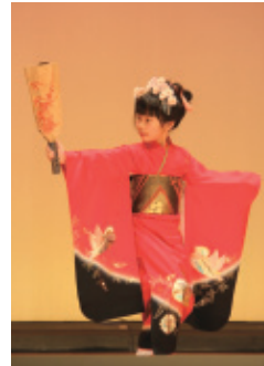
2月2日(日) 会場…一宮生涯学習会館

三年に一度の大きな発表会を控えての勉強会ですので、出演者も気合の入った舞台になりました。